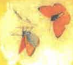
Culvris des marais

Dans les vergers, les prés et les champs, le curivré des marais et la croquette chevêche évoluent grâce à des pratiques culturales vertueuses. Sur la crête du Raemeisberg, une flore spécialisée à l'altitude et aux rochers calcaires fleurit dès février.